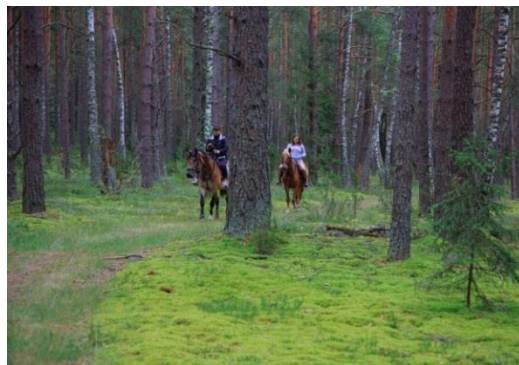
Проехать верхом по лесным тропам заповедника