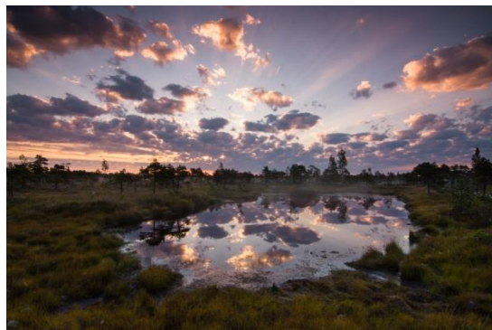
Пройтись ночью по верховому болоту и встретить рассвет