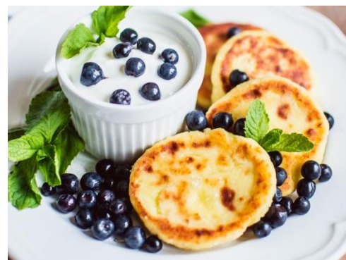
Попробовать полезные блюда местной кухни