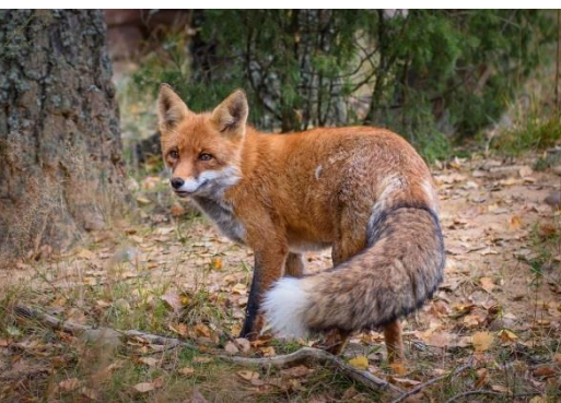
Увидеть вживую обитателей заповедника