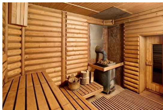
Расслабиться в бане после насыщенного дня